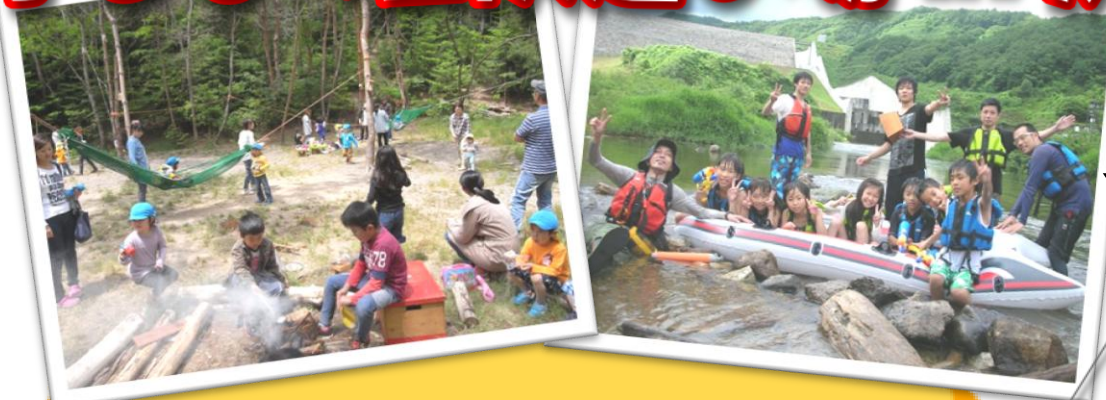
★写真はイメージです