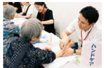
▲ハンドケアは毎回恒例のもので、参加者の人気が高いコーナーの1つ