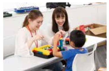
▲キッズスペースも充実。子どもたちはスタッフと一緒にゲームを楽しんだ