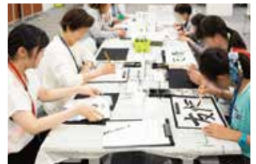
▲文字を書いたり、切り絵を貼ってオリジナル葉書を作成するコーナーも

今後も参加される皆さんがイベントとして楽しみつつ、避難生活に関する様々な情報を得られる交流会にしたいと考えています。この会がキッカケとなり、顔見知りができたと喜んでいる方もいらっやいます。スタッフが対応いたしますので、お1人でも是非気軽にお越しください。