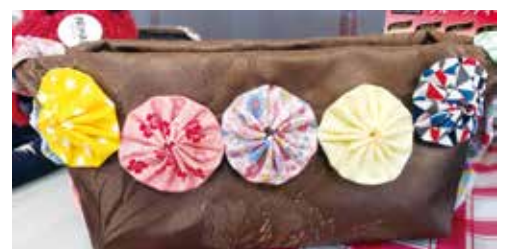
▲避難者の方の作品。交流会でのお菓子入れも作成していただきました