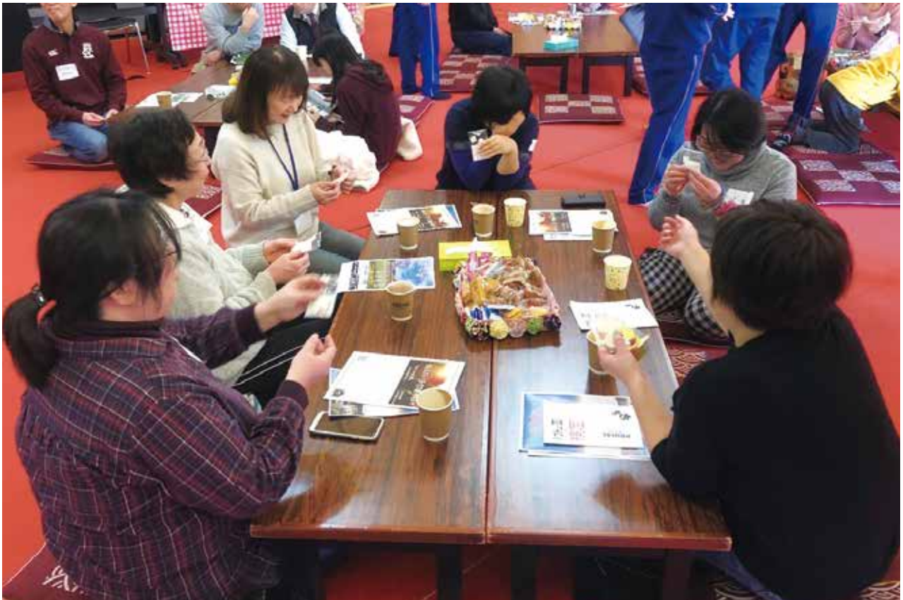
▲生徒さんからせっけんを手渡され、喜ぶみなさん