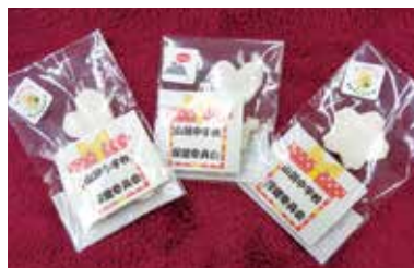
▲山潟中学校の生徒さんが作ってくださったせっけん

参加者の方からは、美味しいコーヒーを飲みながらいろいろな人と話ができてよかったとの声がありました。また、体を動かすレクリエーションやけん玉検定などで冬の1日を楽しく過ごすことが出来ました。