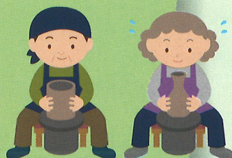
近隣住民の陶芸教室