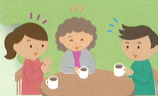
地域住民の交流会