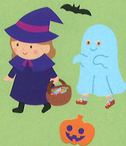
地域のハロウィンパーティー