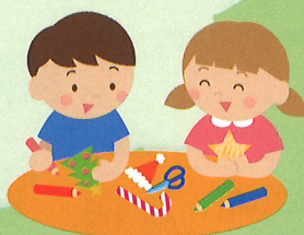
子育てワークショップ